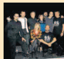
Integrantes del grupo musical.