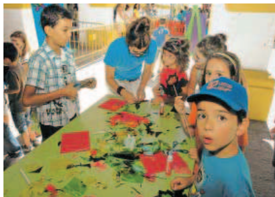
Los niños participaron en los talleres bajo el cobijo de los soportales.