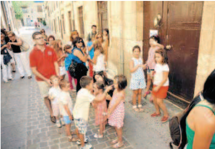
Solos o en compañía de adultos, los pequeños son ya grandes consumidores de teatro.