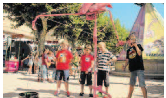
Un gigantesco "flamenco" se alza en mitad de la plazuela del Buen Alcalde.