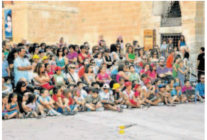
Un nutrido grupo de niños en el espectáculo de Javier Malabares en la plaza de Herrasti.