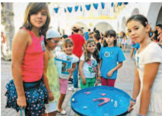
El juego de las letras de colores también conquistó a los participantes.