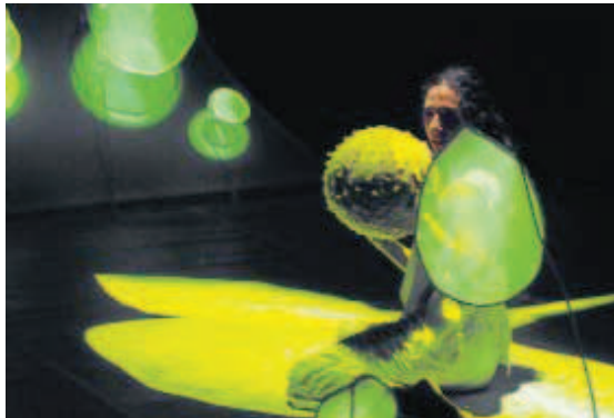
Danza interactiva y artes visuales en la obra "Farfalle-Mariposas".

Solos o en compañía de sus mayores, los niños de Ciudad Rodrigo son ya unos grandes consumidores de teatro que llenan, al igual que hacen los adultos, los aforos de los distintos escenarios