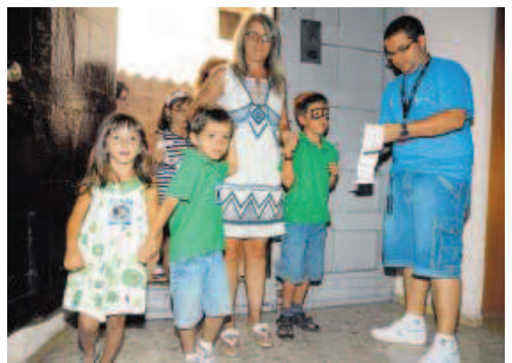
Tres niños a la entrada de uno de los espectáculos de ayer.

Un cuidado, más mimo, que se deja sentir al inicio de cada representación infantil con la explicación de la obra que van a ver.