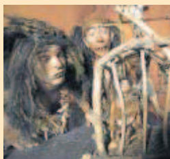
Componentes de Tanxarina Teatro.

La obra: Tres trogloditas invitan a entrar en el primer teatro de la prehistoria, la cueva, donde el público asistirá a un cómic espectáculo lleno de humor y locura. Una insólita función donde de la mano de los títeres y sus habilidades más primitivas, van a conocer la forma de vida de nuestros antepasados más divertidos. Una sorprendente ambientación con un original lenguaje.