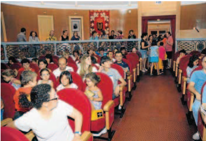
El Teatro Nuevo "Fernando Arrabal" lleno de pequeños en una sesión de la Feria.