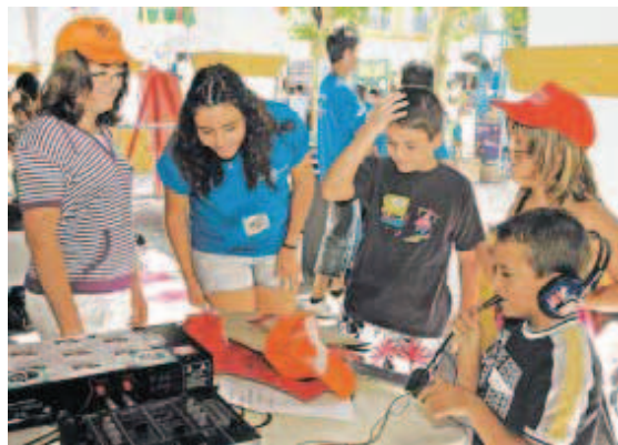
Niños participando en el taller de sonido del Divierteatro.