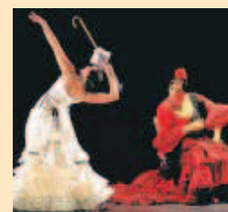
Choni Cía. Flamenco en su obra.

La obra: Gloria es la madre de una bailaora que comienza a despuntar en el mundo del flamenco. Debido a su temprana e inesperada maternidad y a la época en la que le tocó vivir; Gloria, no pudo dedicarse al mundo del espectáculo como ella hubiera deseado.