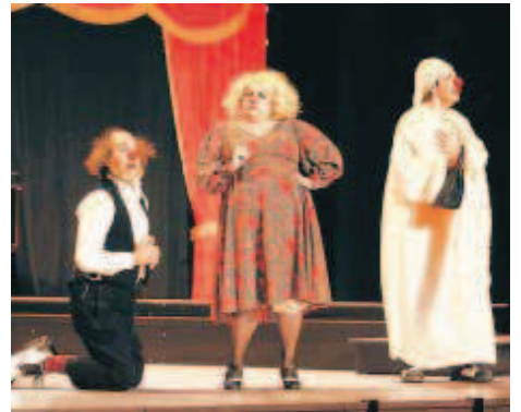
La Sonrisa representó "Smile" en el Teatro Nuevo.