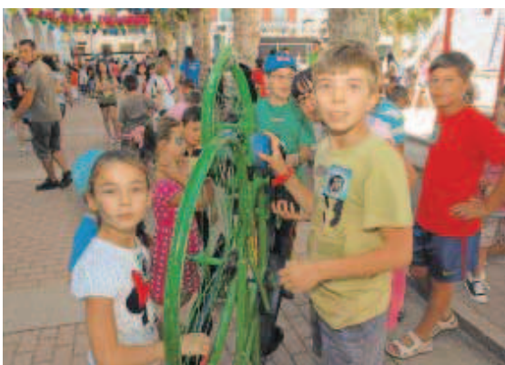
El juego de la rueda fue uno de los que más interés suscitó entre los niños.