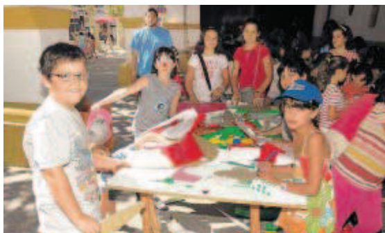
El programa del Divierteatro acogió ocho talleres con diferentes temáticas.