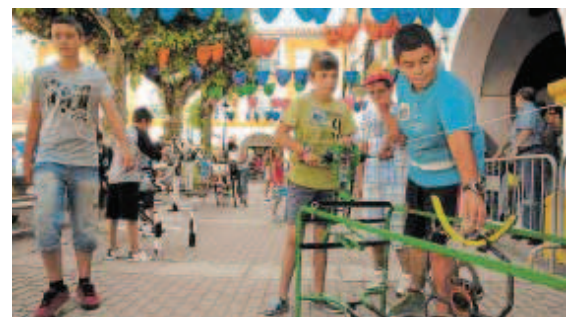
Varios pequeños jugando con el "mono" de la compañía Katatrak.