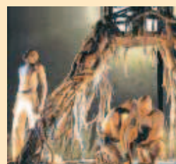
Espectáculo callejero “Solum”.

La obra: Es un espectáculo de calle multimedia y no verbal representado en una estructura escénica de gran tamaño alusiva a un árbol cruzando el teatro físico y visual con los lenguajes del circo/acrobacia aérea, de la danza del vídeo y de la música original Solum se detiene esencialmente en la naturaleza humana.