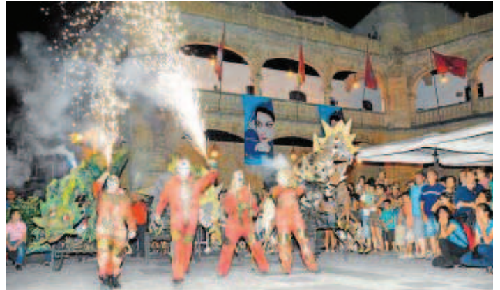
El pasacalles de fuego y pirotecnia de Teatrpo, "Drakonia", en la Plaza Mayor mirobrigense.