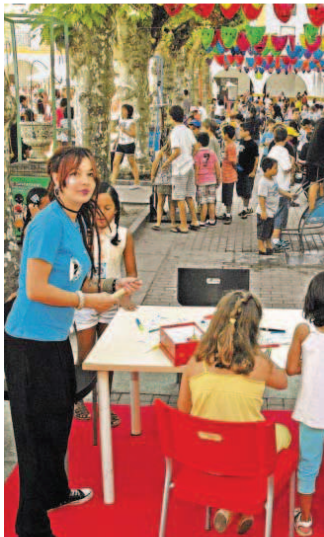
El Divierteatro cuenta con cerca de 70 monitores.

GRANDES JUEGOS. Además de vistosos espectáculos, el "Divierteatro" tiene espacio para grandes juegos. El gigante divierdiccionario teatral ayuda a familiarizarse con el vocabulario teatral, mientras que, por ejemplo, "El teatro, toda una historia", ayuda a conocer sus claves históricas.