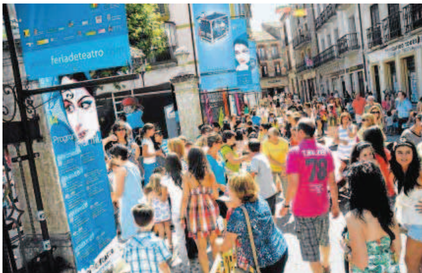
Las calles de Ciudad Rodrigo recibieron ayer a numerosos niños y jóvenes que se disfrutaron con la Feria.