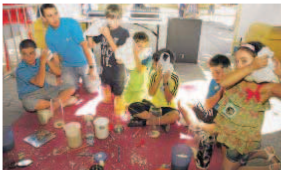
Los niños aprendieron a realizar efectos de sonido con material cotidiano.

El "Divierteatro" volverá a la jornada que hoy comienza a ofrecer toda la diversión entre las 10:30 y las 13:00 horas.