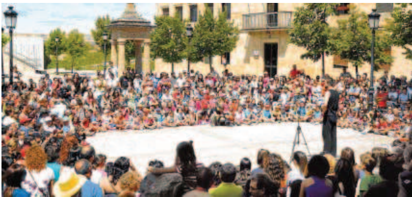
La plaza de Herrasti se llenó por completo durante el espectáculo de Javi Malabares.