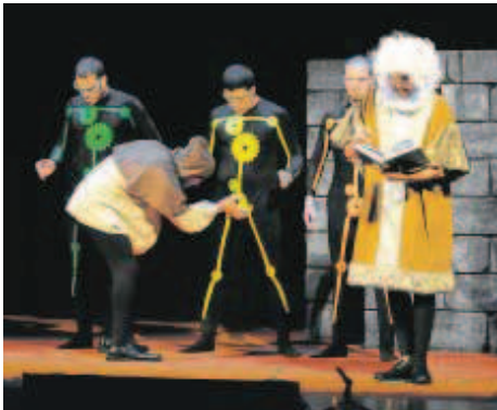
"Ebook. Las edades del libro", de Spasmo Teatro.