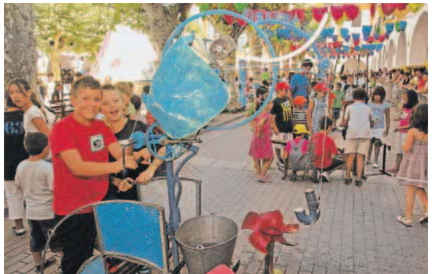
El "elefante" es uno de los artilugios de "Animalada" más solicitado por los pequeños.