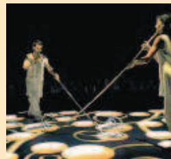
Momento del espectáculo.

La obra: Farfalle es un espectáculo de danza interactiva y artes visuales, no convencional, dedicado a los niños y niñas pintores y bailarines a través de la historia del nacimiento y vida de las mariposas, vistas como bailarinas y pintoras que danzan y pintan en el aire con sus alas, con su vuelo.