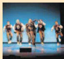
Bailarines en la obra.

La obra: Technized, la calle en directo es el primer espectáculo creado y dirigido por Supremos Crew. Un show único que mezcla hábilmente el ambiente de la cultura urbana y una producción teatral. Supremos Crew se crea en 1995, es uno de los grupos pioneros del B-boying .