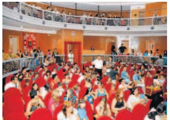
El Teatro Nuevo "Fernando Arrabal" acogió dos de los espectáculos.