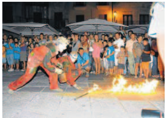
El público familiar también recibe la atención de la Feria de Teatro.