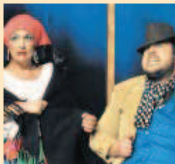
Personajes de la obra teatral.

La obra: Versión libre del Auto sacramental del mismo título, de Calderón de la Barca dirigido a público infantil. Eugenio, un niño que quiere ser músico, es enviado por sus padres al mercado del Mundo, un rastrillo en donde personajes alegóricos, muy cómicos tratan de vender sus mercancías.