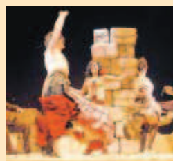
Instante de la representación.

La obra: Una Carmen que se presenta como: mujer instintiva que tiene por bandera su propia libertad y autonomía, mujer que se rebela ante una sociedad machista, mujer con plena independencia sexual, mujer fatal.