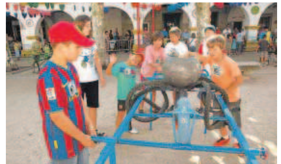
Varios niños intentando encestar la pelota en el "pulpo".

Esta manada de animales divertidos, tiene 6 años de edad y ya ha recorrido distintas ciudades europeas en Inglaterra, Holanda y Francia entre otros. La compañía con estas instalaciones quieren reivindicar la calle como lugar de juego y fomentar la socialización de los niños, escapando así del individualismo al que les someten los videojuegos.